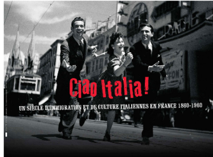
Cinéma : "Ciao Italia", venez découvrir l'exposition visible pendant un mois

L'exposition "Ciao Italia", réalisée par les archives départementales, est actuellement visible au cinéma de Vic-Fezensac, pour une durée d'un mois.