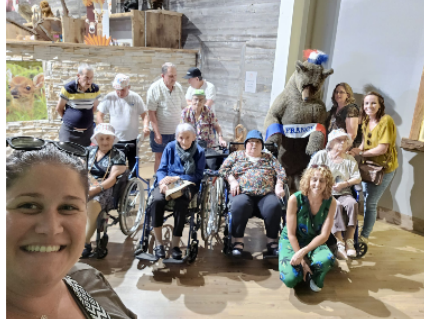
Hôpital : quand les résidents de l'EHPAD partent en vacances...

Chaque année, une dizaine de résidents de l'EHPAD de l'hôpital de Vic-Fezensac partent en vacances quelques jours en compagnie de résidents de l'EHPAD d'Eauze.