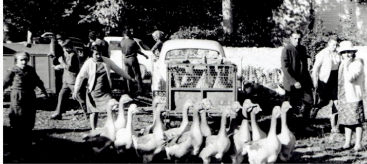
Revenons sur nos pas : le temps de l'oie

Autrefois, la période automnale était marquée par la grande foire aux oies maigres à Riguepeu.