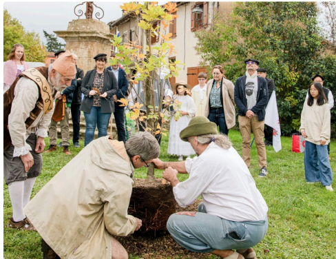
Le chêne est placé dans son trou