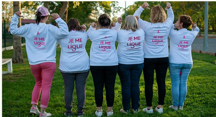
La pétanque en rose