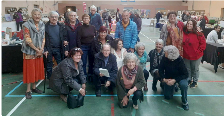
Valeureuses organisatrices, unies comme des mousquetaires..

A l'époque des jeux vidéos, de l'approche de Noël, de la commercialisation à outrance de la moindre manifestation, un petit village résiste toujours et encore. Dimanche toute la journée se tenait le 15eme salon du Livre et de l'Art de Castelnau d'Auzan, ce petit village à une dizaine de kilomètres de Eauze la belle.