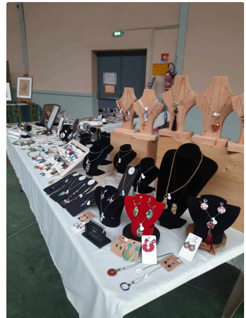
créatrice de bijoux.jpg