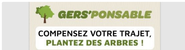
Gers'ponsible, la compensation carbone locale 100% Gers

Le nouveau dispositif de compensation carbone du tourisme qui contribue à la préservation des paysages gersois et de sa biodiversité.