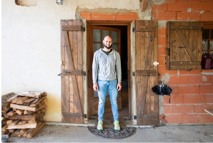
Sauboires (Manciet): arbre magique, le paulownia va-t-il remplacer le peuplier?

Un arbre à croissance rapide, anti-pollution, léger, résistant, très peu inflammable etc.: il a presque toutes les qualités