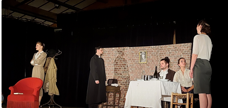
Encore une excellente soirée entre rires et larmes avec In$ Off !

Après nous avoir proposé deux one woman show pour démarrer l'année théâtrale, l'association vicoise In $ Off renouait avec une pièce de théâtre vendredi soir dans la salle polyvalente.