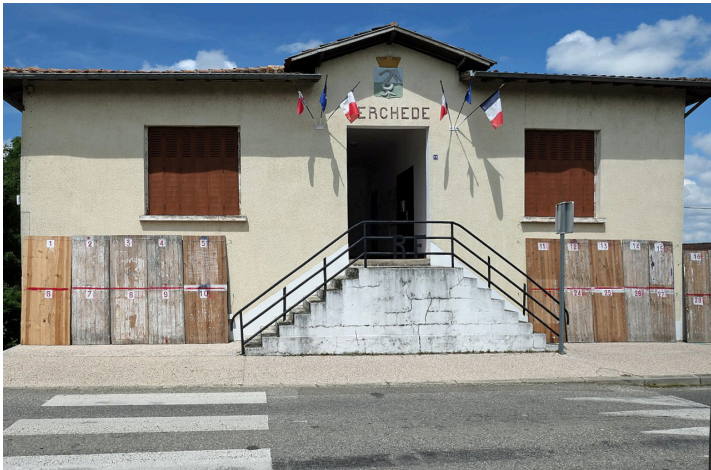
La façade de la mairie avant les travaux

« Les élus se retroussent les manches à Perchède : ils ont repeint la façade et les volets de la mairie, la salle du conseil a été détapissée (le papier peint âgé de 40 ans a été enlevé), puis réentoilée avec de la toile de verre que l'on a repeint et le plafond a également été repeint. Enfin le sol en parquet a été poncé puis vitrifié, les plinthes et les fenêtres repeintes, un beau lustre (un don) a été installé, et le couloir a été également repeint en totalité.