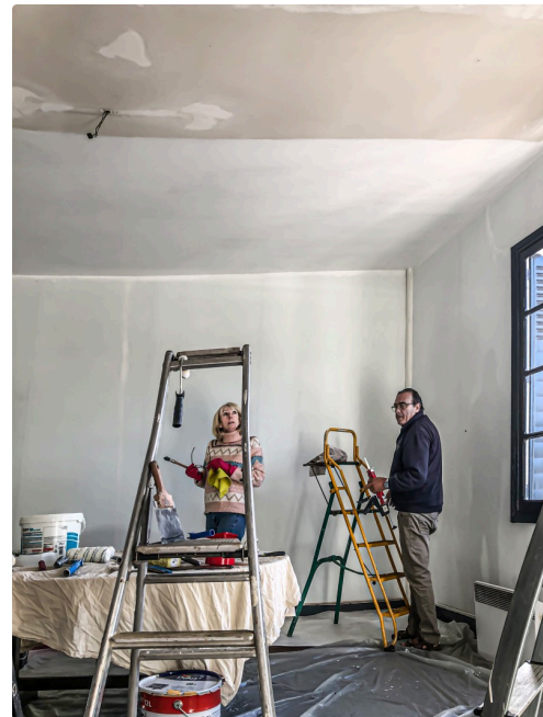
Le chantier avance