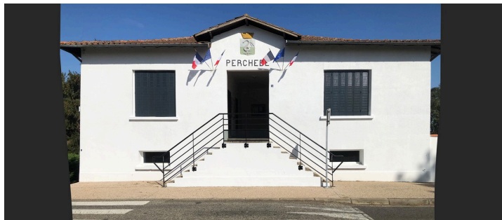
La façade de la mairie après les travaux

Merci au conseil municipal qui s'est retroussé les manches, ainsi qu'aux bénévoles de la commune qui ont également donné de leur temps libre au service du bien commun. Je les remercie vivement !