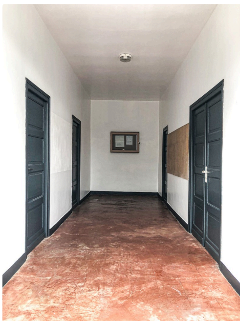
Le couloir après sa réfection