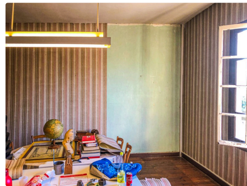
La salle du conseil pendant les travaux