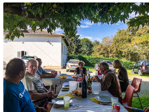
Le repas de midi des bénévoles