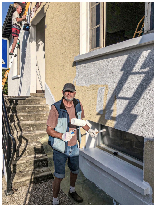
Peinture de la façade

Ces travaux, bien plus conséquents pour notre petite commune de 119 habitants, ne se feront qu'après les demandes de subventions aux autorités qui seront sollicitées pour nous aider financièrement. »