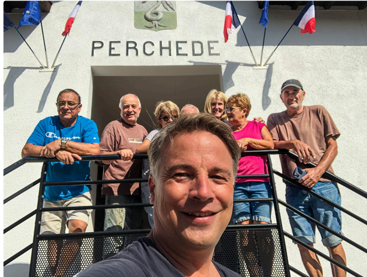
Les élus et les bénévoles de Perchède se retroussent les manches: ils ont rénové la mairie