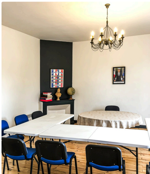
La salle du conseil après rénovation