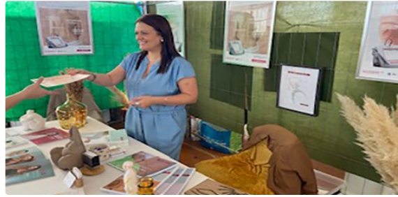
La Luxopuncture arrive dans le Gers.