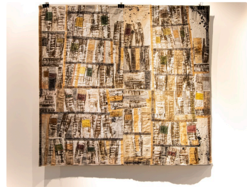
6 tableau de Michel Danton 1bis 161123.jpg