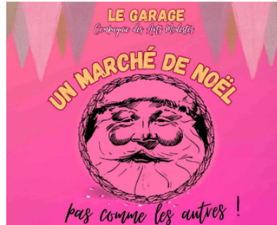
Un marché de Noël pas comme les autres !

"Un marché de Noël pas comme les autres", c'est ainsi qu'est intitulée la démarche de la compagnie Les Arts Modestes.