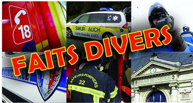
Feu d'appartement le pire évité

Lundi soir vers 18h les sapeurs-pompiers de Montesquieu Mirande, Miélan, l'Île de Noé et Vic-Fezensac ont été engagés sur un départ de feu sur la commune de Montesquieu rue Nationale. Le feu a pris dans la salle de bain d'un appartement et s'est propagé dans une chambre et dans les combles, mais a pu être contenu dans ces espaces grâce à l'intervention rapide des secours. Deux personnes, deux hommes de 67 et 59 ans, incommodés par les fumées ont reçu des soins sur place. 16 sapeurs-pompiers ont été engagés dans cette action avec deux engins feu, un camion échelle, une ambulance, et un véhicule de commandement. Sur place la gendarmerie, enedis et le maire Etienne Verret