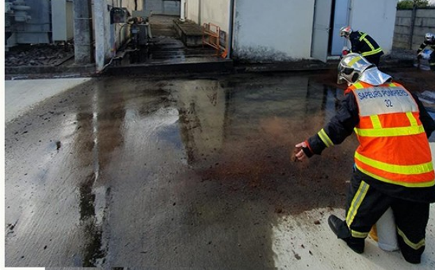
Incendie dans un transformateur 30.000v

Lutte contre la vente et la consommation de produits illicites