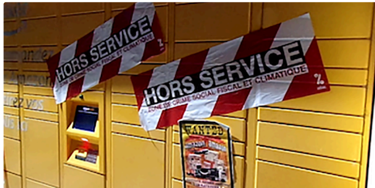
Des consignes Amazon mises hors service à l'occasion du «Black Friday»