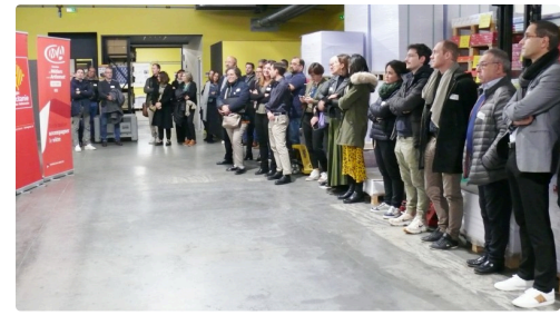
Invités et salariés de BCR.