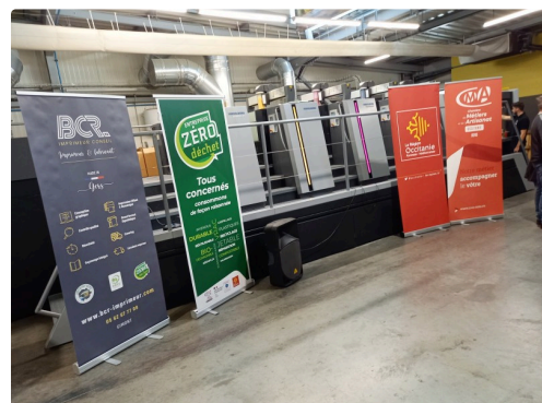
Tout est prêt pour inaugurer la presse OFFSET XL 106 4 + VERNIS.

Après les remerciements à tous les principaux partenaires et des félicitations à Perrine Crochet de la CMA du Gers « qui a beaucoup œuvrée pour l'organisation de la journée », les gérants de BCR concluront : « BCR c'est aujourd'hui 33 années d'existence, 20 collaborateurs, 800 tonnes de papier transformé et 4,3 M de CA. Une organisation qui nous permet de produire en 3x8 et de couvrir la plage horaire journalière pour les enlèvement/livraisons ainsi que l'accueil phoning et le traitement des fichiers et BAT de 7 h à 20 heures non STOP. Maintenir un haut niveau de Qualité, réactivité, service, est notre objectif principal ».