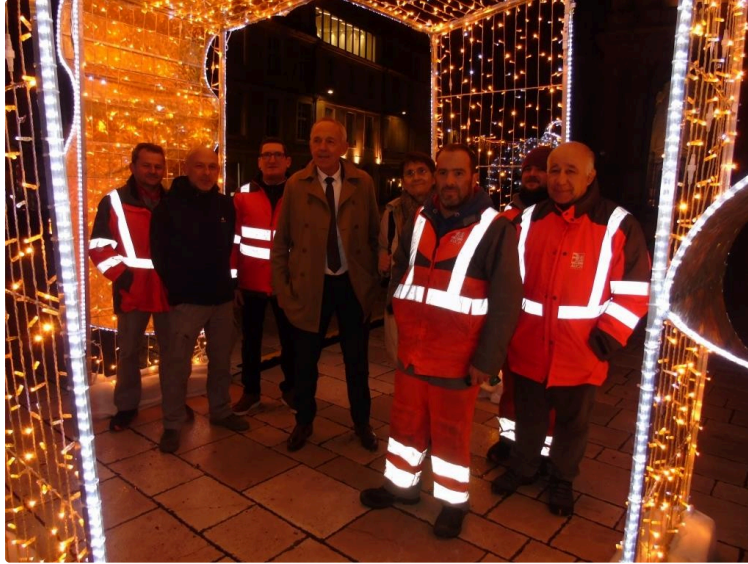
Auch, ville lumière 2023 : un feu d'artifice de couleurs, éblouissant, éclaboussant , enthousiasmant

Hier vendredi 1er décembre , jour de l'Avent, dès la tombée de la nuit Christian Laprèbende, maire d'Auch, a lancé les illuminations de Noël qui ont scintillé de la haute à la basse ville en passant par les quartiers.