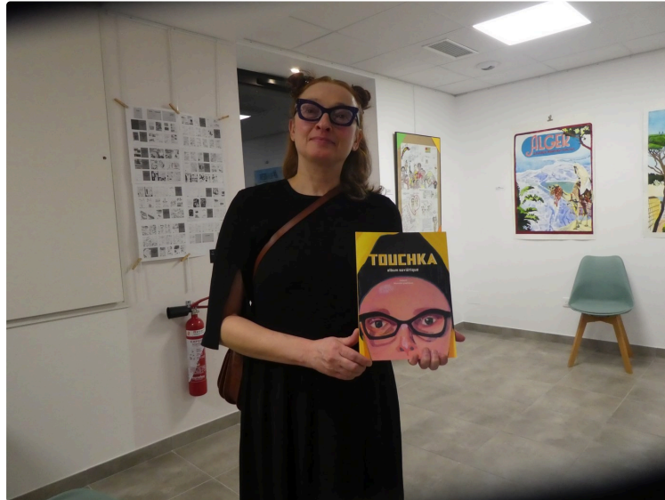
Exposition " Vies d'ailleurs, Nouvelles d'ici" par l'association "Nouvelles Graphiques"

Ala Médiathèque et Office du Tourisme jusqu'au 31 janvier