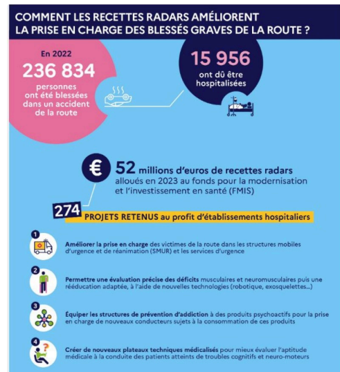
prevention routiere affiche radars.JPG

Prise en charge des blessés graves de la route : 52 millions d'euros de recettes radars alloués au fonds pour la modernisation et l'investissement en santé