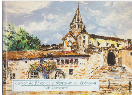
Flânez à Montaut-les-Créneaux avec Alain Cantarutti

On connaît Alain Cantarutti pour ses peintures tauromachiques pleines de vie, une vie que l'on retrouve dans tous ses tableaux.