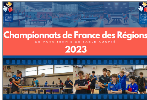
Le Championnat de France des Régions de Para Tennis de table Adapté, c'est ce week-end !

Le Comité Départemental de Sport Adapté du Gers développe dans le Gers les activités physiques et sportives adaptées pour le public en situation de handicap mental, psychique, ou avec Troubles du Spectre Autistique (TSA).