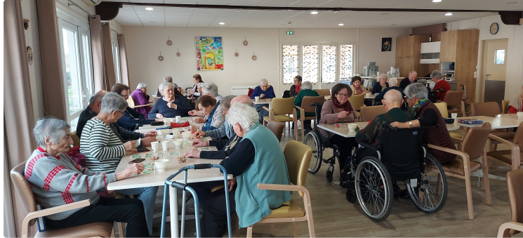
Quand petits et grands partagent un loto à Château Fleuri...

Le silence règne dans la grande salle de Château Fleuri en ce vendredi après-midi, un silence qu'interrompt régulièrement l'annonce du numéro sortant et de manière plus tonitruante, un « quine » ou « carton plein » !