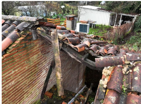
eauze maisons effondrees.jpeg

MONTESTRUC - Ce samedi matin sur le coup d'une heure, un accident de circulation sur la RN21, impliquant un seul véhicule, à hauteur de la commune de Montestruc a fait trois blessés légers. 2 jeunes hommes de 21 et 19 ans et une jeune fille de 17 ans. Les victimes avaient pu sortir seules du véhicule à l'arrivée des secours. Elles ont été transportées sur l'hôpital d'Auch. Moyens engagés : 3 ambulances, 1 véhicule de balisage et un véhicule de désincarcération avec 16 pompiers.