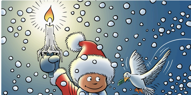
Avec les meilleurs vœux de Boule à Zéro

L'héroïne de la bande dessinée de Serge Ernst nous adresse ses meilleurs vœux.