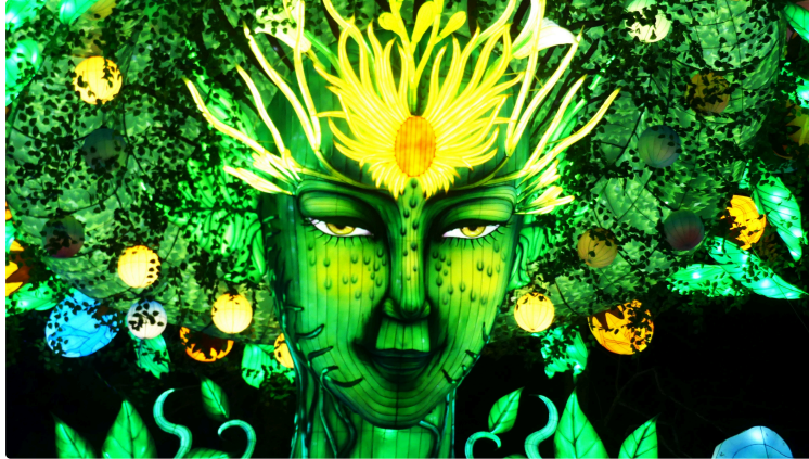
La féerie du festival des lanternes

Le Festival des Lanternes est avant tout un grand succès populaire qui a déjà réuni plus de 2 millions de personnes venues de France, d'Europe et du monde entier. Il a su conserver au fil des éditions sa magie. C'est pour toujours surprendre son public et lui offrir une nouvelle fois un spectacle inédit que cette année, le Festival des Lanternes se réinvente : Un nouvel écrin : Le Festival des Lanternes s'installe pour cette 6ème édition (Gaillac 2017-2018-2019, Blagnac 2021, Montauban 2022 et 2023) dans le magnifique Jardin des Plantes situé en plein cœur de Montauban du 15 décembre 2023 au 11 février 2024. De nouvelles animations : Si la tradition ancestrale artisanale reste le socle du Festival des Lanternes (les artisans chinois viennent, chaque année, plus d'un mois pour créer quelques 2500 lanternes), c'est un festival 100% renouvelé, interactif et ludique qui associe tradition et nouvelles technologies.