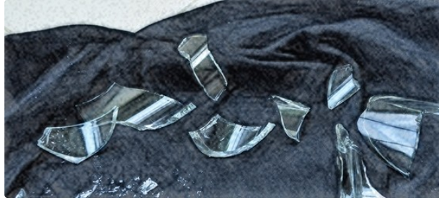
La Marmandox versus la Fée qui Recolle les Morceaux

Les festivités sont terminées mais la magie de Noël n'a pas encore tout à fait disparu.