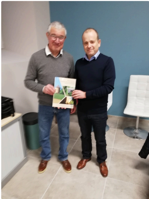
Montesquiou 03122023 (6).jpg