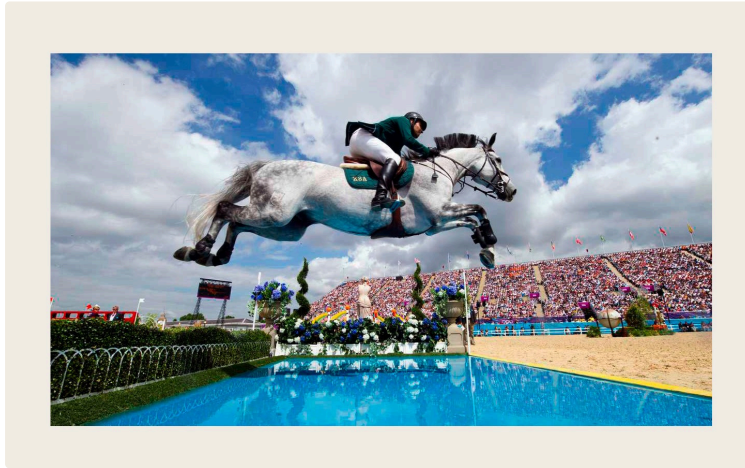
Alfred Gardère, du Houga, unique Gersois médaille d'or olympique

En équitation, il remporte le saut d'obstacle en hauteur avec Canéla en 1900