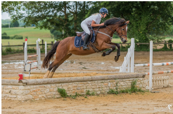
Un saut d'obstacle (photo extraite du site [ https://www.graindepixel.fr/ ])

(1) Le Livre de raison est ce journal, mi-agenda, mi-mémoire, à côté des préoccupations matérielles, que tenaient nos ancêtres à l'usage de leurs descendants (extrait du prière d'insérer). (2) Selon les recherches de Claude Saint-Lannes. (2) Sources : La République du Houga, par J-F Lacôme d'Estalenx, pp. 201-208 ; Archives du Gers : recensement des populations et registres matricules militaires. Le livre de Stéphane Gachet JO d'été - Tous les médaillés français de 1896 à nos jours (Talent Sports). (3) Le semis direct consiste à semer directement dans les résidus de la culture précédente, sans travail du sol au préalable. En évitant le labour, le semis direct privilégie les processus biologiques, fait gagner du temps, limite les intrants et la mécanisation (Wikipedia).