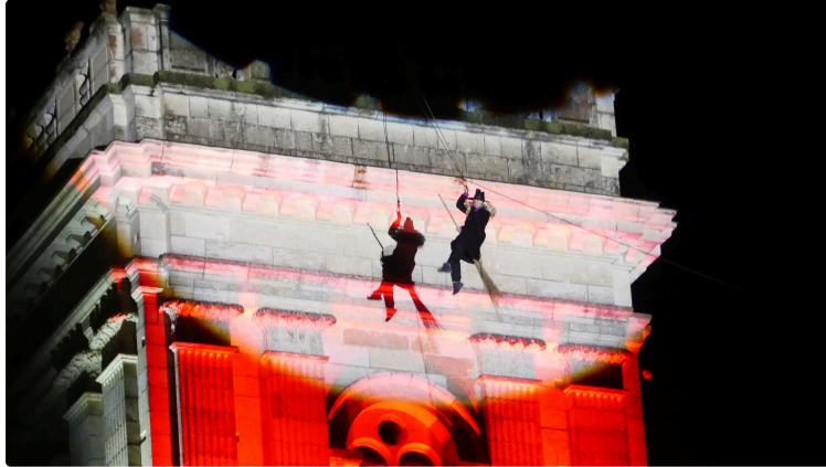
Auch 6 janvier : La befana est de retour pour la joie des enfants