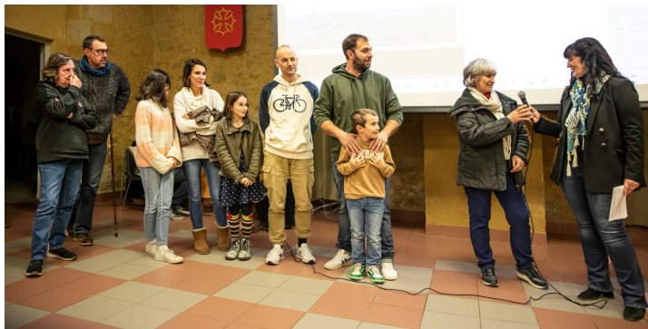
Les nouveaux arrivants présents

Cette dernière, en liaison vidéo pendant la réunion depuis les Antilles présente ses vœux à l'assemblée.