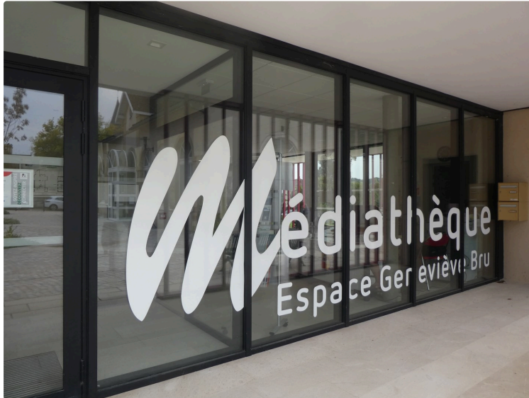
Le mois de janvier à la Médiathèque