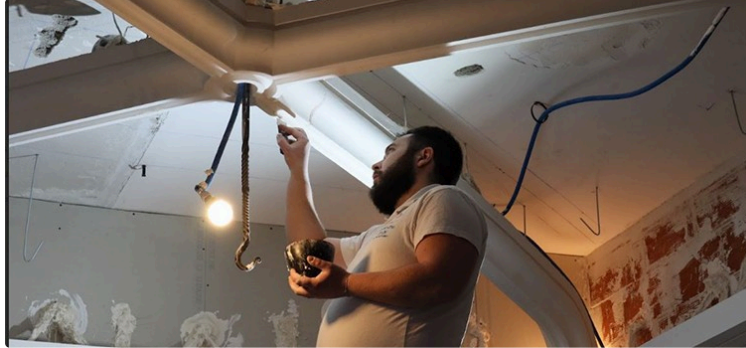
Journées Portes Ouvertes des Compagnons du Devoir