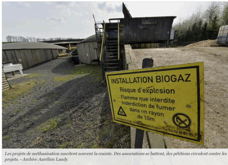
Les projets de méthanisation suscitent souvent la crainte. Des associations se battent, des pétitions circulent contre les projets.

Incendie à Saint-Michel : la Confédération paysanne du Gers communique