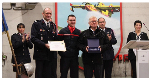
pompiers employeurs 5.jpg