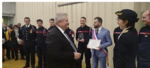
pompiers employeurs 3.jpg