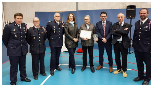
pompiers employeurs 1.jpg