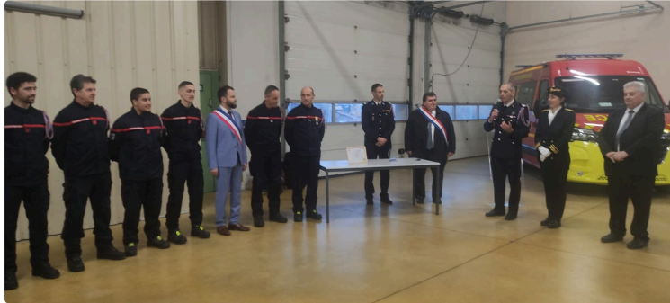
les sapeurs pompiers et leurs employeurs