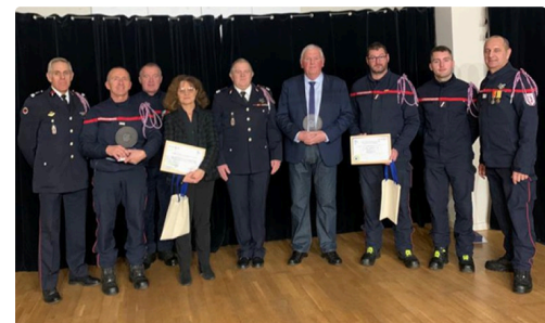
pompiers employeurs 4.jpg