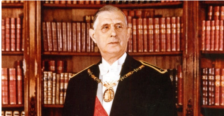
La 5ème République et sa constitution