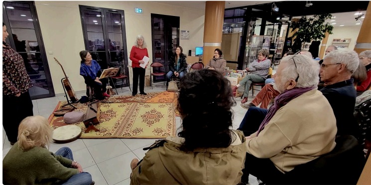
A demain dans les étoiles

Une belle soirée lecture a eu lieu samedi dernier à la médiathèque de Lombez.