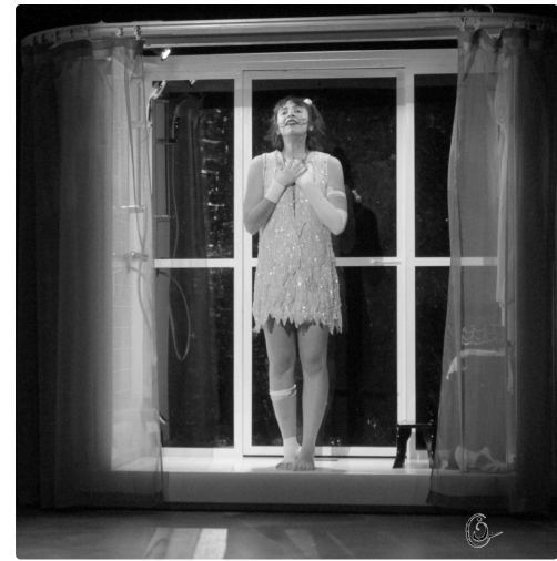
fille douche 2NB.jpg