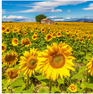
« La MSA vient vers vous » à Nogaro

Une réunion publique de la MSA Midi Pyrénées Sud a eu lieu le 6 février 2024