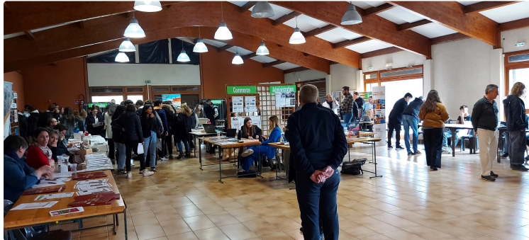
Près de 700 élèves de 3e peaufinent leur orientation sur le forum des formations !

La salle polyvalente de Vic-Fezensac n'a pas désempli jeudi dernier.