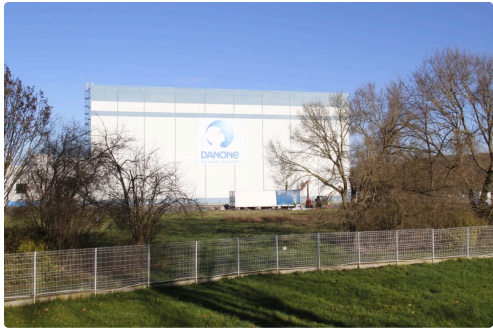
Danone 12022024 (4).JPG