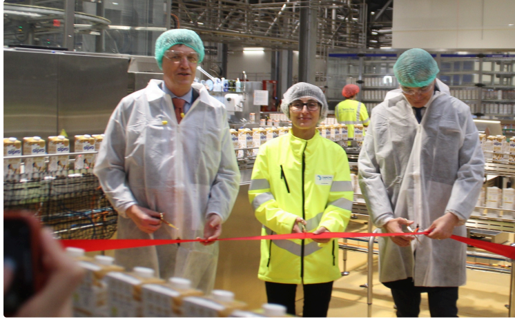
Danone inaugure une nouvelle usine à Villecomtal sur Arros

Autour de Villecomtal sur Arros, tout le monde connaissait « la Laiterie » qui collecte le lait de vache depuis 63 ans. Il va falloir changer ses habitudes. En effet, cette entreprise du groupe Danone ne fabrique plus de produits lactés mais des boissons d'origine végétale à base de farine d'avoine.