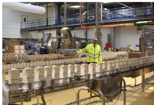
Danone 12022024 (19).JPG