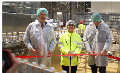
Danone 12022024 (21).JPG

Danone a réussi à développer un nouveau modèle de production et de nouvelles compétences pour s'adapter aux attentes des consommateurs, tout en optimisant ses sites de fabrication de produits laitiers.