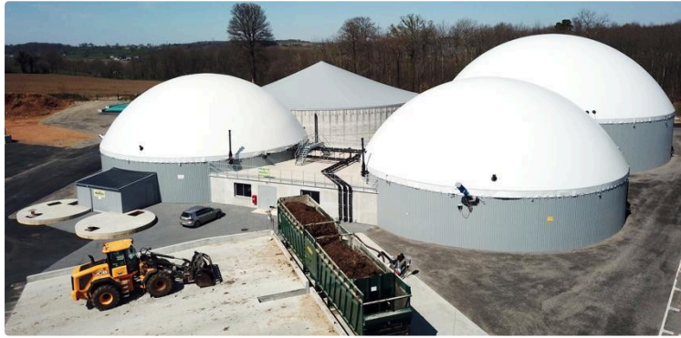
Salon à la ferme : colloque sur la méthanisation en ouverture

Dans le cadre du Salon à la Ferme, la Confédération Paysanne organise un colloque sur la méthanisation