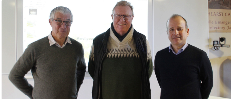
Sur les traces des moulins de Pardiac Rivière Basse