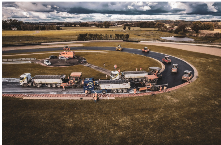
Le circuit pendant les travaux