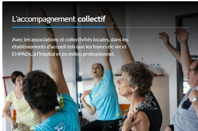
Activité Physique pour les plus de 60 ans!