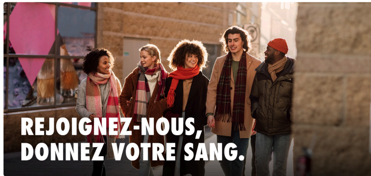
En mars, vous aussi, donnez votre sang !

Comme tous les mois, l'Établissement Français du Sang (EFS) invite chacune et chacun à donner son sang pour continuer à répondre aux besoins des patients.