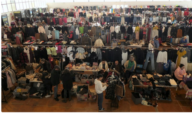
Un vide-dressing qui a tenu toutes ses promesses

Organisé par le Comité des Fêtes, sous la grande halle, ce premier vide-dressing a rassemblé pas moins de 57 exposants avec une organisation sans failles, à la grande satisfaction de tous. Une installation très fluide dès le début de la matinée, des rangées de tables bien alignées derrière lesquelles les vêtements les plus significatifs étaient mis en valeur accrochés aux gilles, de larges travées de circulation, des cabines d'essayage à la fois très fonctionnelles et panneaux publicitaires puisque grâce, à un ingénieux subterfuge, elles n'étaient au départ que le support de photos faisant découvrir le futur PNR. C'était plutôt une atmosphère de grande braderie !