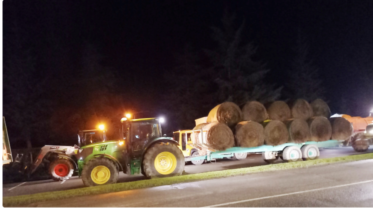
"La muraille de paille" conclut l'action de la coordination rurale

Dans la continuité de l'action menée dans la nuit de lundi à mardi à Vic-Fezensac, la coordination rurale a conclu son action « Muraille de paille » mardi 5 mars de 22 h 30 à 3 heures du matin ce mercredi. Une opération où participaient une douzaine de tracteurs et leurs remorques chargées de bottes de paille et quelques déchets. C'est vers 22 h 30 que le cortège des manifestants démarra depuis le parking de l'hippodrome pour se diriger vers les différentes agences bancaires de la ville. Un déploiement aux sons des klaxons qui se déroula sans le moindre incident mais qui bloqua les entrées principales des banques.