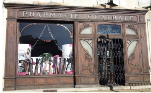
La mythique pharmacie Pérès