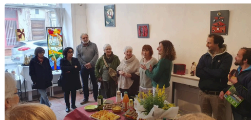
gimont expo mars.jpg